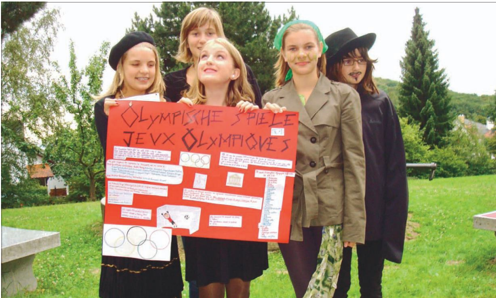
Stolz präsentierten die Jugendlichen vor dem Bürgerhaus Falkenstein die Ergebnisse ihrer Gruppenarbeit zum Thema Spiele.